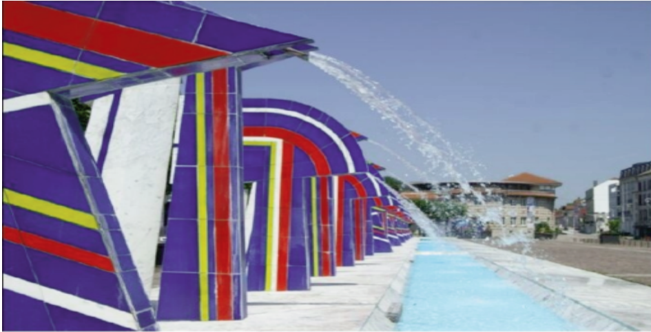
2016 Les fontaines multicolores et les thermes

En 1987, la municipalité décide de restructurer le centre ville par une réalisation destinée à le dynamiser ; pour rompre sa linéarité, l'architecte Nicolas Normier souligne avec des fontaines multicolores l'axe central de l'esplanade et ouvre en diagonale une perspective formée de terrasses, il joue sur l'eau et les couleurs.