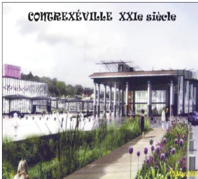
Projet pour le XXI e siècle

La production d'eau minérale n'en demeure pas moins un monde où il est question de production, de profit et de concurrence. Autrefois les deux embouteillages de Contrexéville et Vittel employaient près de 3000 personnes ; en 2010 à force de modernisation, Nestlé Waters employait encore 1250 personnes et envisage aujourd'hui de réduire ce chiffre en dessous de 1000. Cette déflation n'a pas été sans conséquence sur le bassin d'emploi, sur l'économie locale et sur le chiffre de la population des deux villes qui s'est nettement réduit.